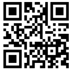
Example of a label with QR code

004816005EF8 ABEBMA C67AUP 2ZUWG6 SPN3CG 7N75JJ HOJCQJ